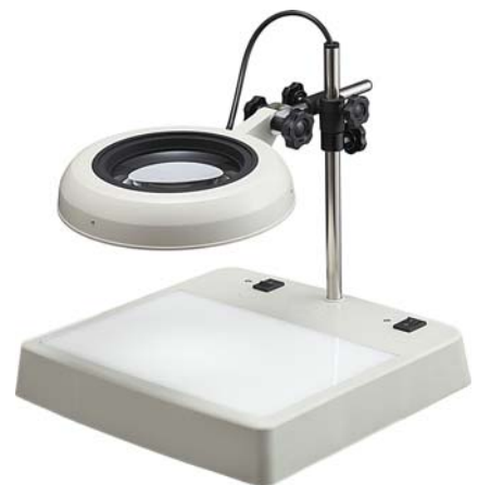
具上下灯式 Light Box Type 型号: SKKL-CL / □X*