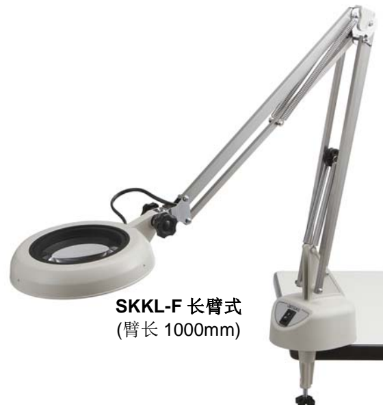
SKKL-F 长臂式 (臂长 1000mm)