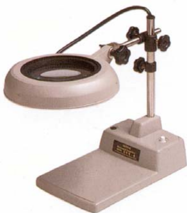
台架式 Table Stand Type 型号: SKK-B / □X*