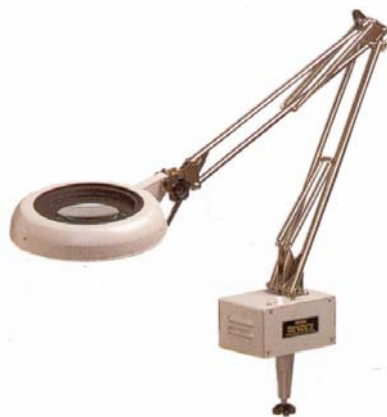
自由杆臂式 Free Arm Type 型号: SKK-F / □X*