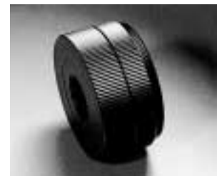
配相机或摄像机接环