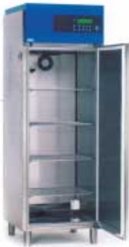
4201 / 4601

可另购可编程控制器, 最多可作 70 级的设定 (需于订购时选定) Optional Programmable Controller, maximum 70 steps