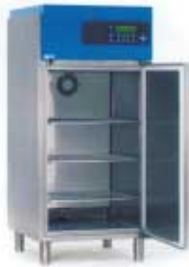
4101 / 4501