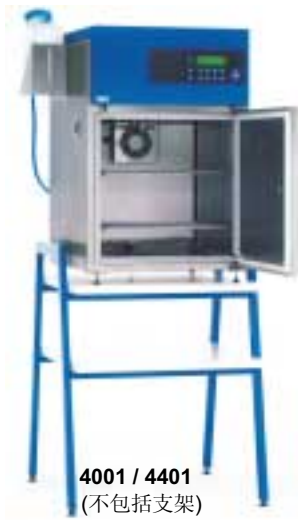
4001 / 4401 (不包括支架)