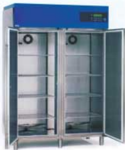
4301 / 4701