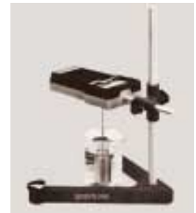
VT-04F 连 VA-04 支座 (VA-04 支座需另购)