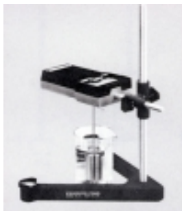
VT-04F 连 VA-04 支座 (VA-04 支座需另购)