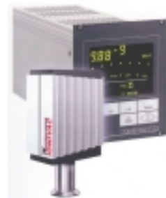
COMBIVAC / IONIVAC 真空测量仪表

香港科學儀器社有限公司 Che Scientific Co. (Hong Kong) Ltd. Tel: (852) 2481 1323 Fax: (852) 2418 1302