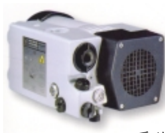
TURBOVAC 系列 陶瓷轴承涡轮分子泵