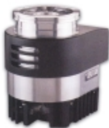
SOGEVAC 单级油封旋片真空泵