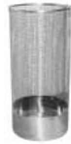
Bottomed Baskets 不锈钢篮(高身型)