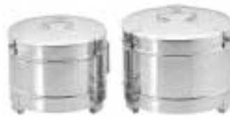
Dressing Drums 不锈钢鼓形圆桶