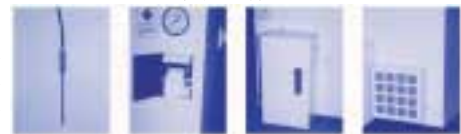
温度传感器 打印机 自动供水装置 冷却装置