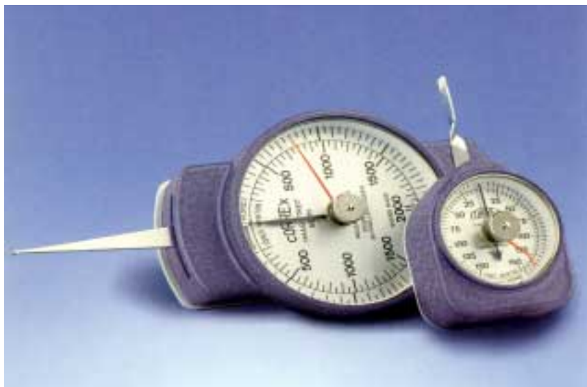
图示： 大型圆头触针(KM) 小型平头触针(FM)

瑞士 CORREX 张力计适合于精确测量继电器接点压力, 微型开关、阀门、精密弹簧压力, 刻度盘测量仪器主轴压力, 自动电话设备接点和衔铁压力等机械压力, 以及测量和检验打字机, 电传打字机, 电唱机唱头重量, 磁带录音机缓冲装置压力等。